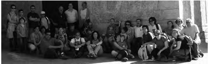
Sortida a La Mola de Colldejou el novembre passat

La Joncosa de Montmell és el poble més gran del Montmell i el que fa de cap de municipi. Està situat a 430 m. d'altitud, a la vall formada per la mateixa serra del Montmell i la serra de la Montjoia, el peu del puig de les Forques, del puig del Castellot i de la Creu. Les tres primeres cases que es van construir a la Joncosa són: Cal Cintet, Cal Ventosa, on hi ha l'Ajuntament, i cal Papiol. De la font de la Joncosa ja se'n parla l'any 1011.