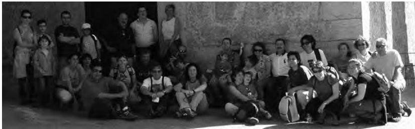
Sortida a La Mola de Coldejou el novembre de 2007

de la Montjoia, el peu del puig de les Forques, del puig del Castellot i de la Creu. Les tres primeres cases que es van construir a la Joncosa són: Cal Cintet, Cal Ventosa, on hi ha l'Ajuntament, i cal Papiol. De la font de la Joncosa ja s'en parla l'any 1011.