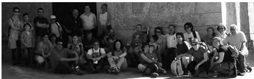
Sortida a La Mola de Coldejou el novembre passat

La Joncosa de Montmell és el poble més gran del Montmell i el que fa de cap de municipi. Està situat a 430 m. d'altitud, a la vall formada per la mateixa serra del Montmell i la serra de la Montjoia, el peu del puig de les Forques, del puig del Castellot i de la Creu. Les tres primeres cases que es van construir a la Joncosa són: Cal Cintet, Cal Ventosa, on hi ha l'Ajuntament, i cal Papiol. De la font de la Joncosa ja se'n parla l'any 1011.